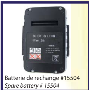
Batterie de recharge #15504 Spare battery # 15504

Consommer moins de papier avec les code QR Consume less paper with QR codes