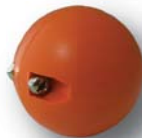
Boule d'arrêt Plastic stop #24670