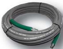
Boyau haute pression High pressure hose 3/8" x 50' : #11308 3/8" x 100' : #13590