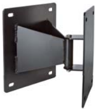
Support pivotant Swing mount assembly #12947