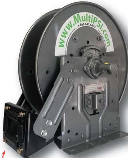
Guide à boyau inclus 4 way roller assembly included