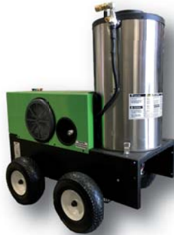
Nettoyeur eau chaude Brûleur à l'huile / 240v 3000psi - 4gpm #19532