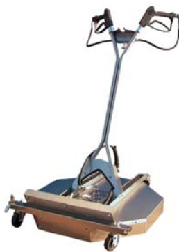
Nettoyeur de surface Diamètre 28 pouces #13184