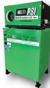
Nettoyeur électrique Eau chaude 575v 3000psi - 4gpm - 48kW #27798