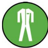
Vêtement de sécurité