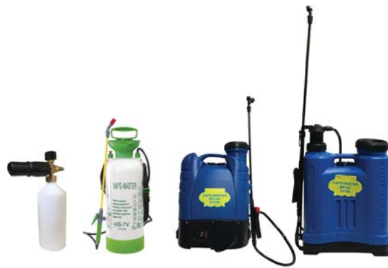
Pulvérisateurs de produits Canon à mousse #11357 Pulvérisateur à main 7l. #11670 Pulvérisateur dorsal manuel 15l. #11673 Pulvérisateur dorsal électrique 15l. #11680