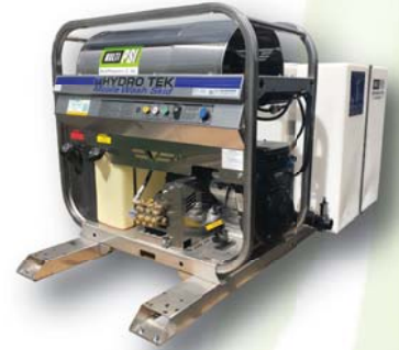
Plateforme eau chaude À essence / Flotte bas niveau 3500psi - 4gpm Réservoir 200 gallons #11830 + #20248