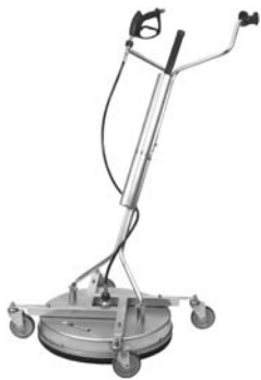
Nettoyeur de surface Diamètre 21 pouces #13184