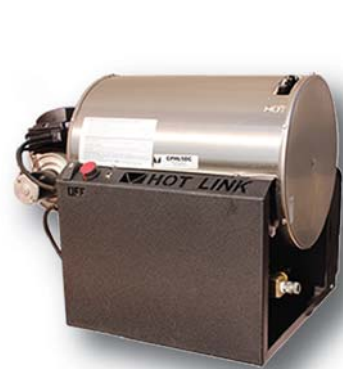
Chauffe-eau électrique Sur le 115v 325,000 BTU #17890