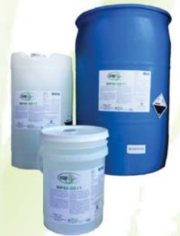
Détergent industriel biodégradable MPSI-5011 20 litres #50113 55 litres #50114 205 litres #50115